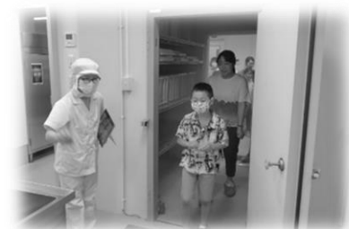
【見学で探検ツアー】

普段は入ることができない調理場内を見学・大型冷凍庫入庫体験・釜混ぜ体験などしてもらいました。