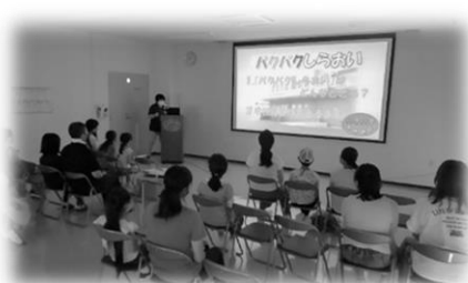
【動画で探検ツアー】

夏休み期間の7月27日(木)、しらおい食育防災センターを見学する『パクパク探検ツアー』を開催しました。学校給食を作る調理場の見学・体験に小中学生とその保護者、教職員ら47名が参加し、給食ができるまでの動画からツアーがスタート！その後は、調理員がガイド役となり、調理場内の探検へ。タブレットで普段の調理風景を確認しながら、大きな釜やたくさんの機械を見て、子どもも大人も興味深々…。また、参加者からは残食の量にため息がもれ、「2学期からは給食を残さず、最後まできれいに食べたい！」と関心を持ってくれたことに、職員一同、大変うれしく感じました。